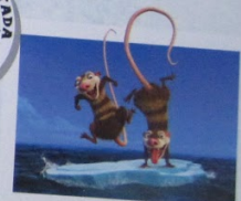
Essa dupla excêntrica transforma uma catapulta em esporte radical: surfando numa onda de gelo em A Era do Gelo 4, derretem continental.